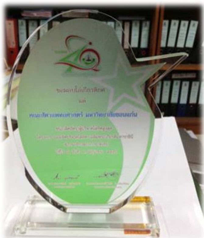
คณะสัตวแพทยศาสตร์ มหาวิทยาลัยขอนแก่น